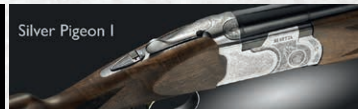
Silver Pigeon I