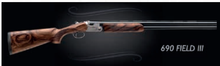
690 FIELD III